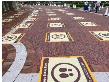
ソーシャル・ディスタンス