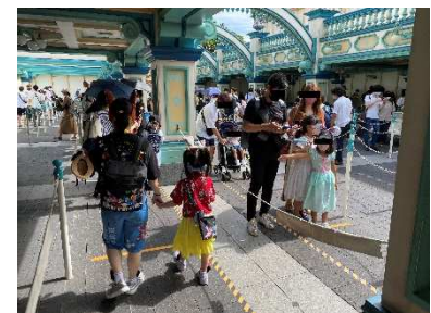
アトラクション施設待ち行列

TDL といえば、各アトラクション施設の待ち行列、60分待ち等はあたり前です。ここでの三密回避、ソーシャル・ディスタンス確保が徹底されていました（※路面が黄色い線だらけ）。結果、ものすごく長い待ち行列にはなっていたものの、前後左右に適度なスペースがあるため圧迫感がなく、待ち時間は変わらないものの進んでいる感があり、以前よりもストレスが軽減された感がありました。