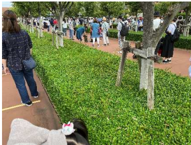
正面入り口の待ち行列

さて、我が家ではムスメの誕生日祝いということで、東京ディズニーランド（以下、TDL）へ行ってきました。当初は「大丈夫かなあ〜?」「コロナ対策はどうなの?」と心配していましたが、、、さすがはTDL、普段の生活空間よりも対策が施されていた感があります。